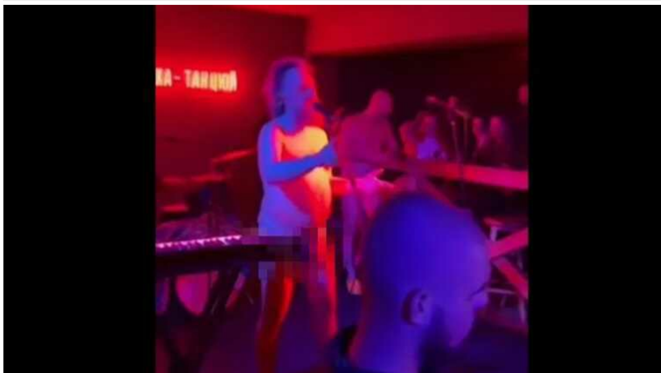
На курорті Драгобрат у розпал війни влаштували голу вечірку, але "зрада" скасовується

На гірськолижному курорті Драгобрат у розпал війни відбулася дивна подія –