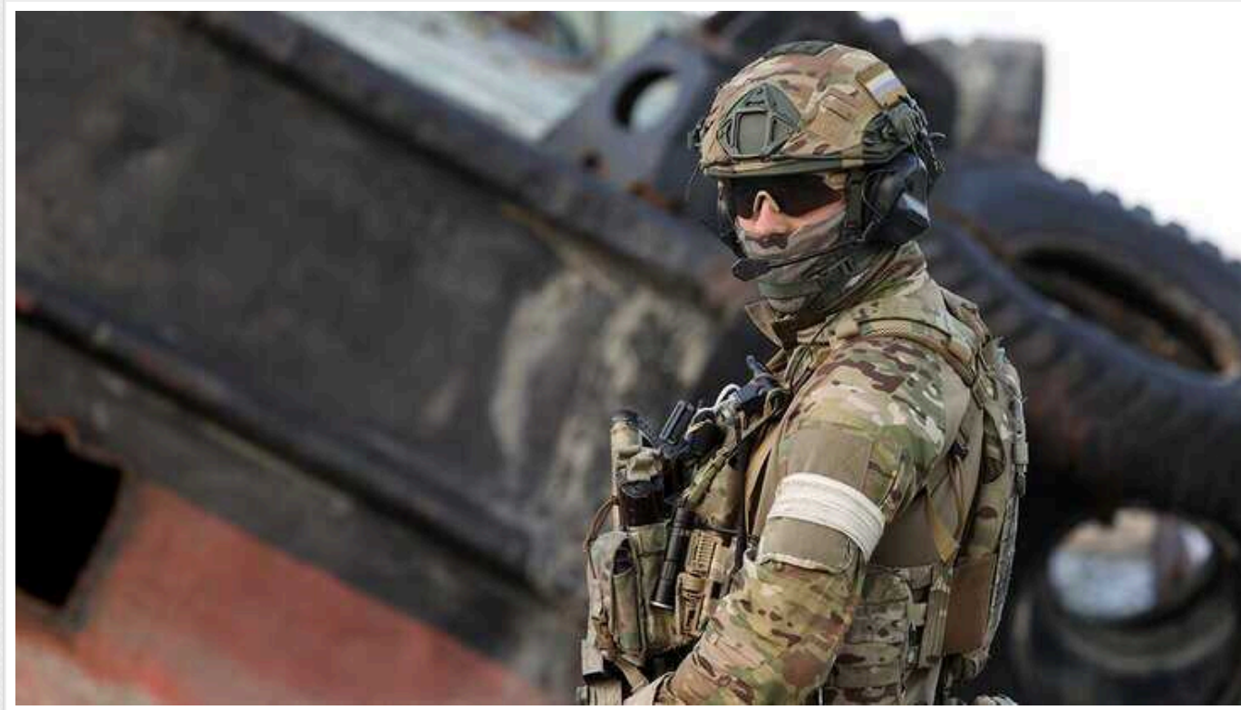
Окупанти впритул підійшли до Табаївки та б'ють із артилерії по Берестовому: у DeepState оцінили ситуацію

У DeepState роз'яснили ситуацію щодо населених пунктів Табаївка та Берестове Харківської області, про захоплення яких заявили росіяни. Станом на вечір суботи, 27 січня, ця інформація, яку поширювали на ворожих джерелах, не відповідала дійсності.