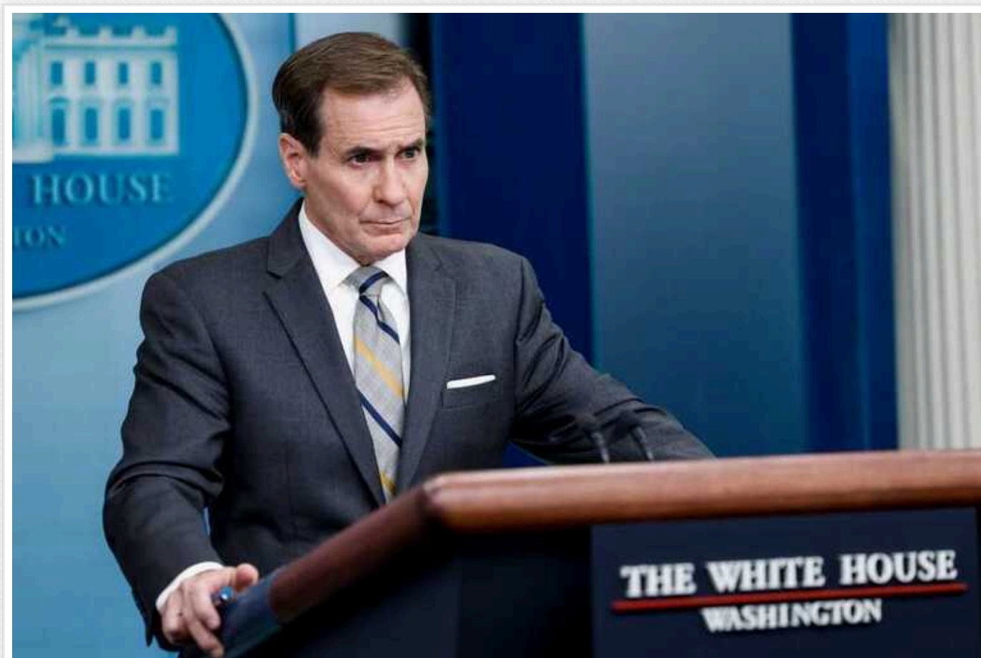
США просуватимуть "Формулу миру" Зеленського, - Кірбі

Координатор зі стратегічних комунікацій Ради національної безпеки Джон Кірбі заявив що Сполучені Штати Америки просуватимуть формулу миру президента України Володимира Зеленського на міжнародному рівні.