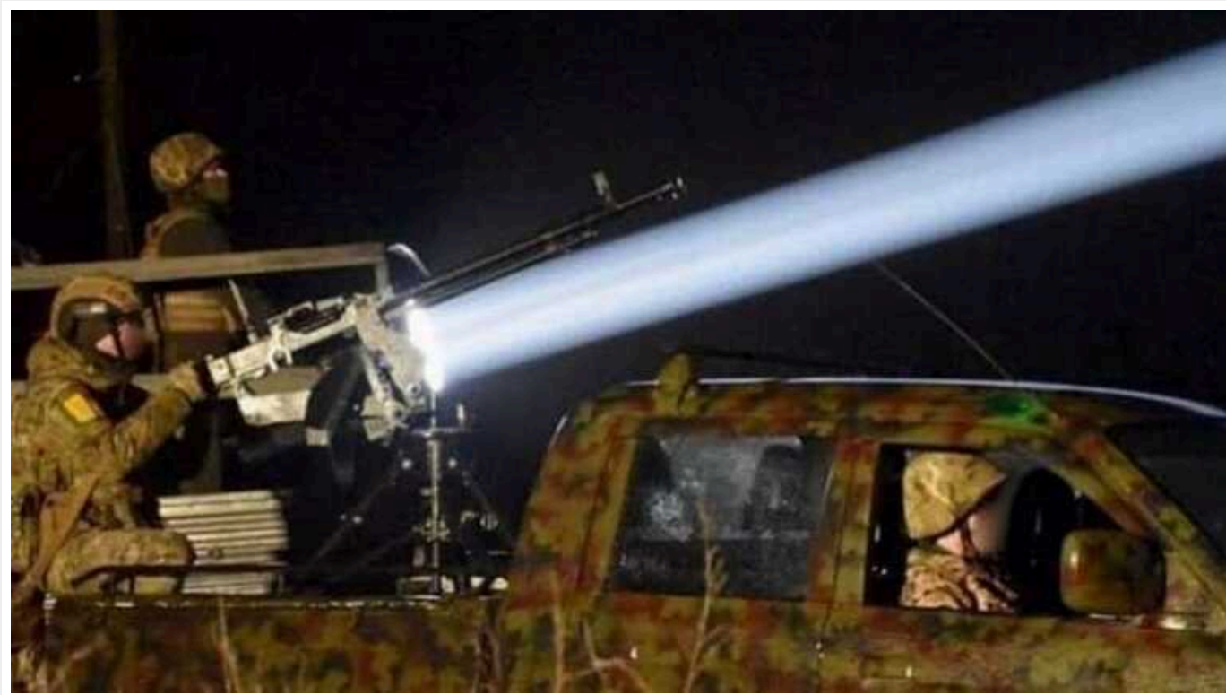
ЗСУ над Дніпропетровською областю знищили "Шахед"

Українські військові знищили у небі над Дніпропетровською областю російський дрон-камікадзе "Шахед".