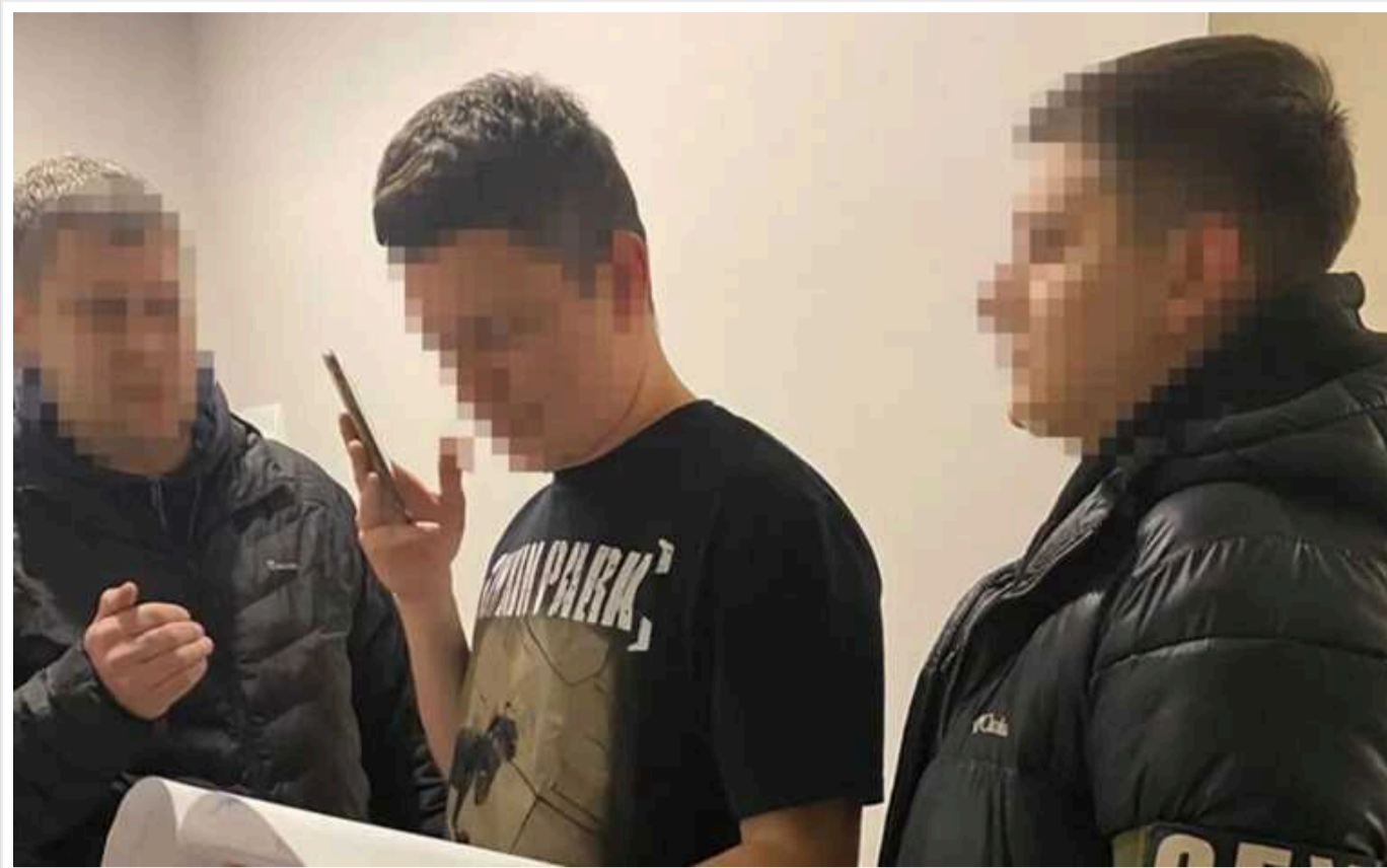
Вкрали майже 1,5 мільярдів гривень на закупівлі снарядів: СБУ викрила чиновників Міноборони та менеджерів "Львівського арсеналу" на гучній схемі

Служба безпеки України за сприяння Міноборони викрила чиновників оборонного відомства і менеджерів "Львівського арсеналу". Вони підозрюються в тому, що вкрали майже 1,5 млрд грн на закупівлі снарядів.