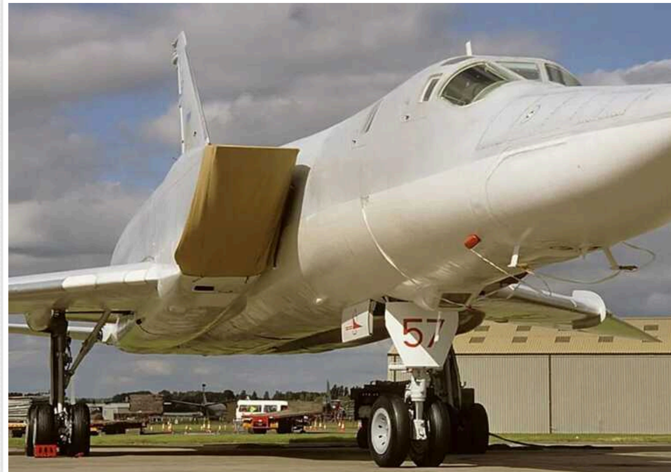
18 років тому в Україні знищили останній бомбардувальник Ту-22М3

В Україні 2006 року знищили останній бомбардувальник Ту-22М3. Це було зроблено в рамках угоди "Про ліквідацію стратегічної ядерної зброї та зброї масового ураження".