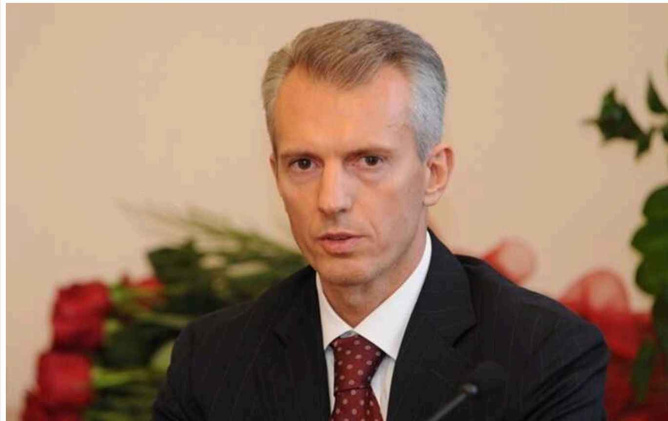
У ексголови СБУ Хорошківського відібрали землю на 1,5 мільярда гривень

Черкаська обласна прокуратура у судовому порядку повернула із приватної власності 65 гектар лісового фонду. Земля належала колишньому голові СБУ та першому віцепрем'єр-міністру України Валерію Хорошківському. Власником деяких наділів є Валерій Хорошківський та його дружина. Загалом прокурори повернули 16 земельних ділянок у Канівському районі вартістю 1,5 мільярда гривень.