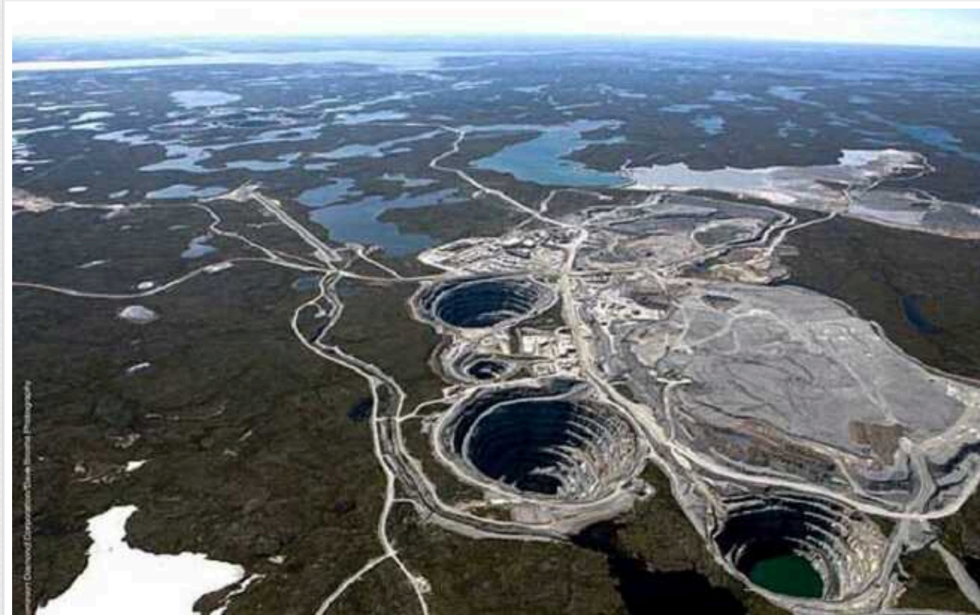
Ангола через санкції хоче вигнати Росію із спільного алмазодобувного бізнесу

Ангола хоче вигнати Росію із спільного діамантового бізнесу. Через санкції, які були накладені на РФ постачальники та банки відмовляються працювати з їхньою компанією.