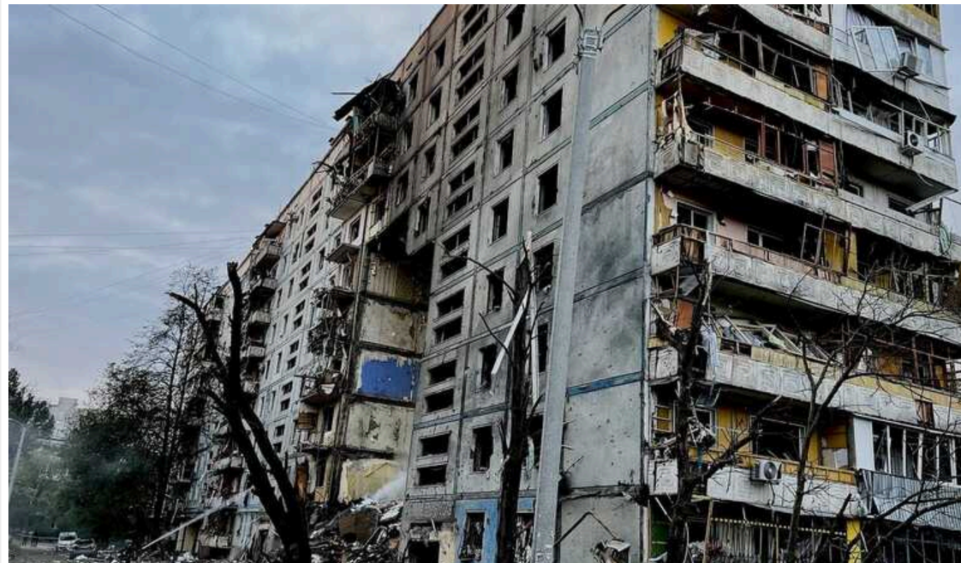
Стало відомо, за якою ціною росіяни продають ушкоджені обстрілами квартири в центрі окупованого Маріуполя

В окупованому Маріуполі Донецької області російські агенти з нерухомості продають квартири місцевих жителів, які залишили місто через вторгнення Росії в Україну.