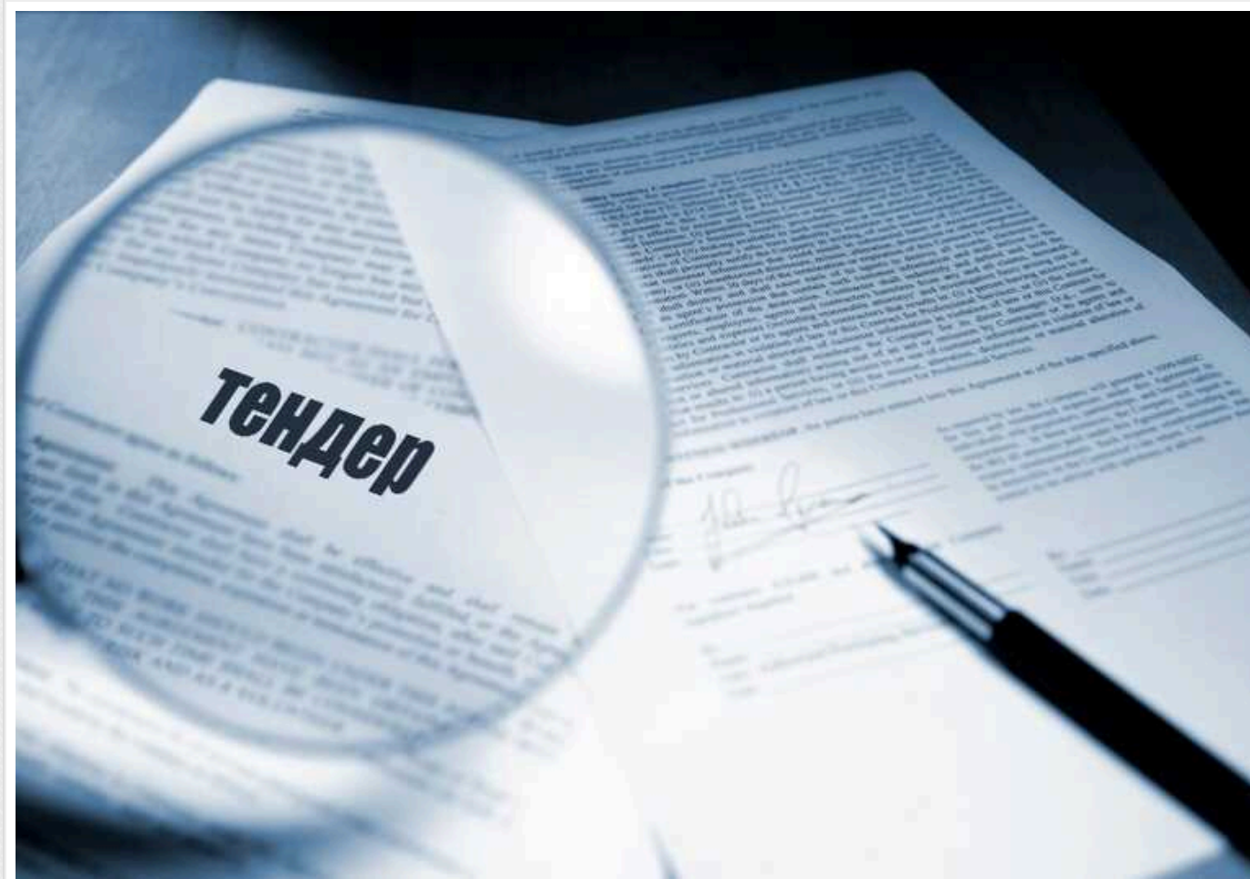
За вивезення сміття з парків Бучі та Ворзеля заплатять 536 тисяч гривень: Бучазеленбуд оголосило тендер

Комунальне підприємство (КП) "Бучазеленбуд" Бучанської міської ради оголосило пошук виконавця послуги з вивезення та утилізації твердих побутових відходів з території громади. Вивезення сміття мають проводити з семи майданчиків, розташованих у Бучі, та з двох локацій у Ворзелі, що коштуватиме понад 536 тис. гривень.