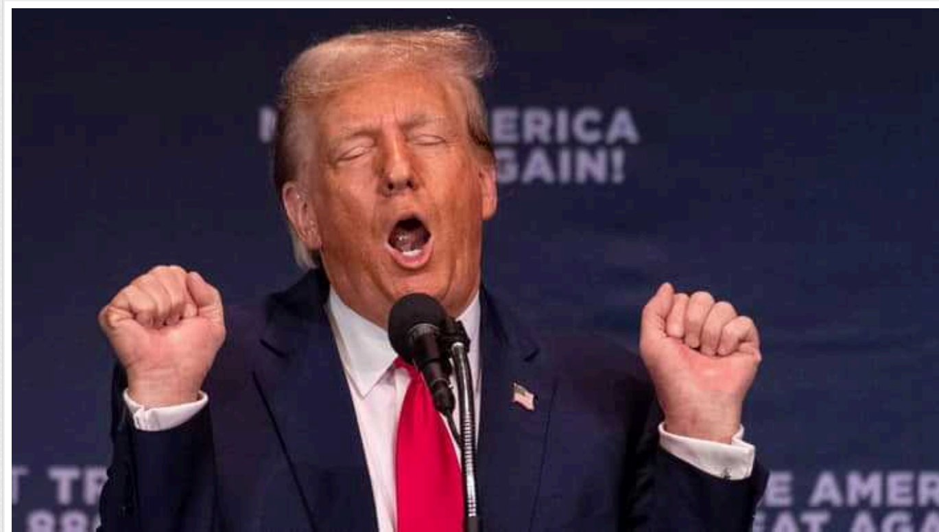
Верховний суд США закликали не допустити Трампа до праймеріз у Колорадо

Представники Колорадо закликали Верховний суд США залишити в силі судове рішення, яке забороняє одіозному американському політику Дональду Трампу брати участь у республіканських праймерізах у штаті. Причиною названо штурм Капітолію в січні 2021 року прихильниками експрезидента Трампа.