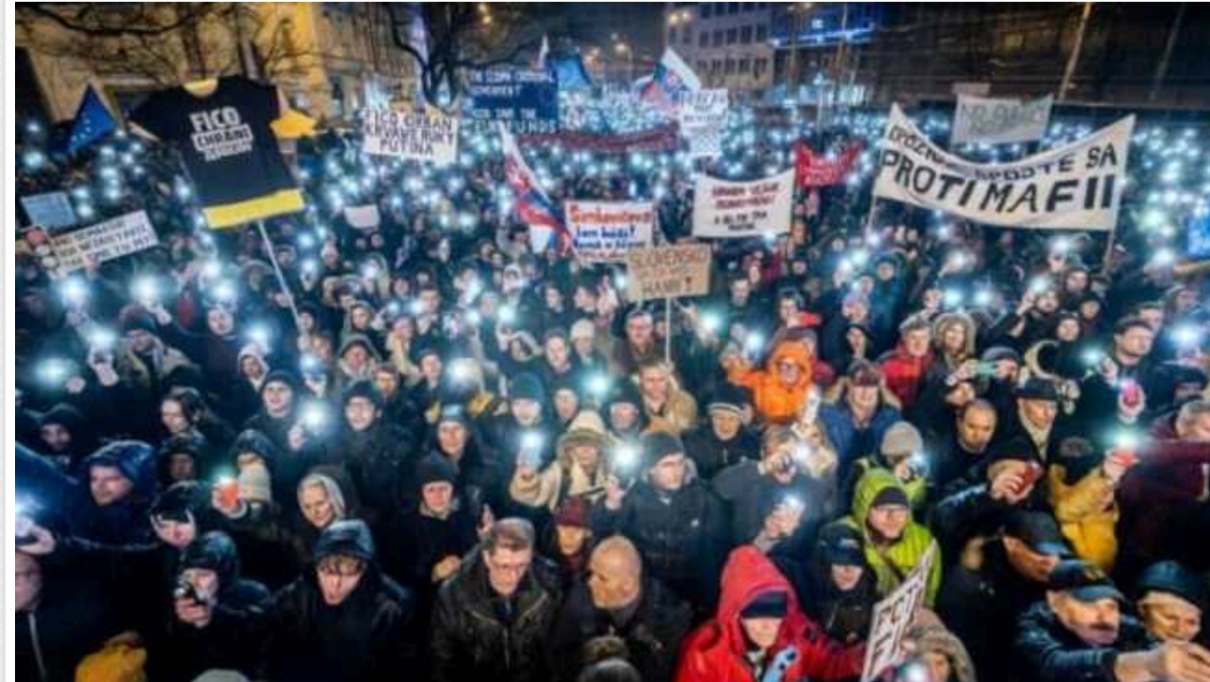
У Словаччині пройшли масові протести проти уряду проросійського прем'єра Роберта Фіцо

У четвер, 25 січня, у низці міст Словаччини пройшли масові протести проти уряду проросійського прем'єра Роберта Фіцо. Лише у Братиславі на вулиці вийшли 27 тисяч людей.