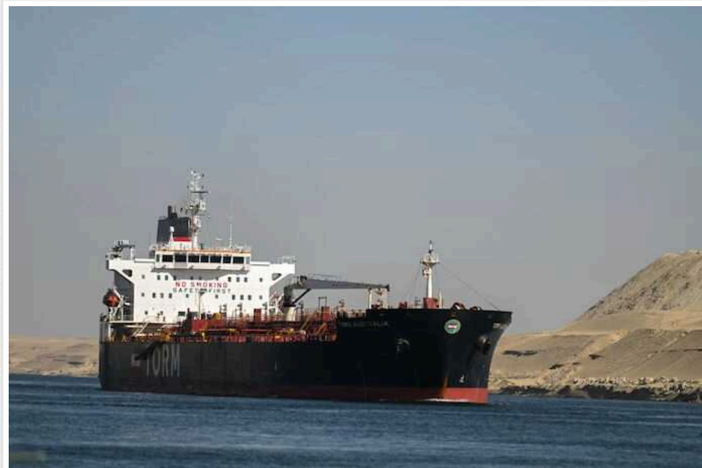
Танкер, який був атакований хуситами, перевозив російську нафту

Танкер компанії Trafalgar, який, за твердженнями представників компанії, перевозив нафту російського походження, був атакований хуситами у Червоному морі.