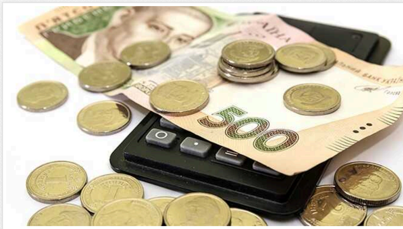
З'явилися деталі схеми ухилення від оподаткування на сотні мільйонів в Одеській області

Наочна схема безтоварних операцій з продажу імпортного податкового кредиту, з маніпулюванням номенклатурою товарів (підміна номенклатури) в межах одного і того ж коду УКТЗЕД.