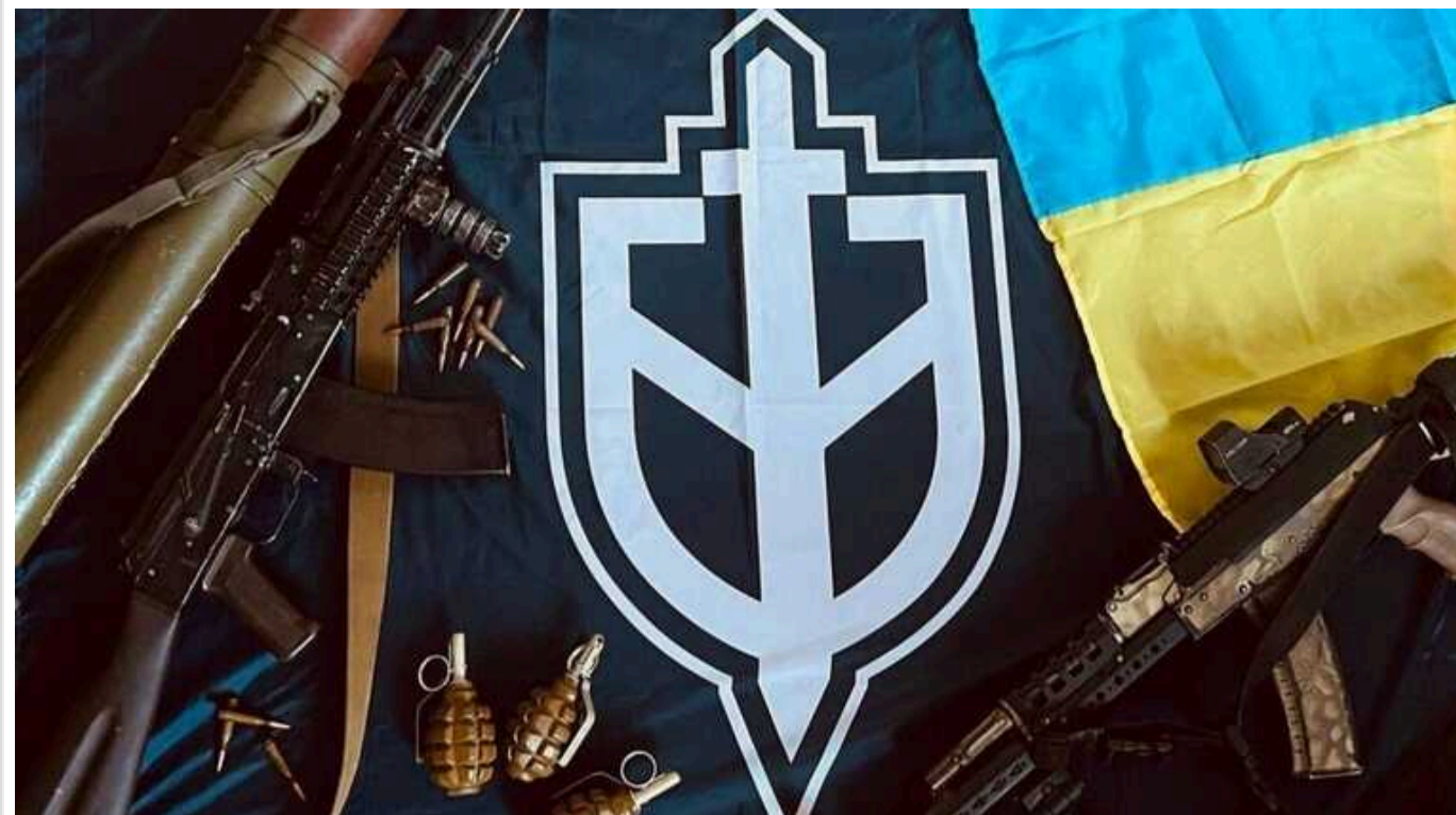
Вийшов фільм про бійців РДК, які прогнозують кінець Путіна: "Росія у тому вигляді, який є зараз, не існуватиме"

В Україні випустили документальний фільм, що має назву "Блідій молі – кінець" про "Російський добровольчий корпус" (РДК). В ньому бійці РДК поділилися метою своєї участі в бойових діях, висловили своє ставлення до України та спрогнозували розпад Росії на республіки.