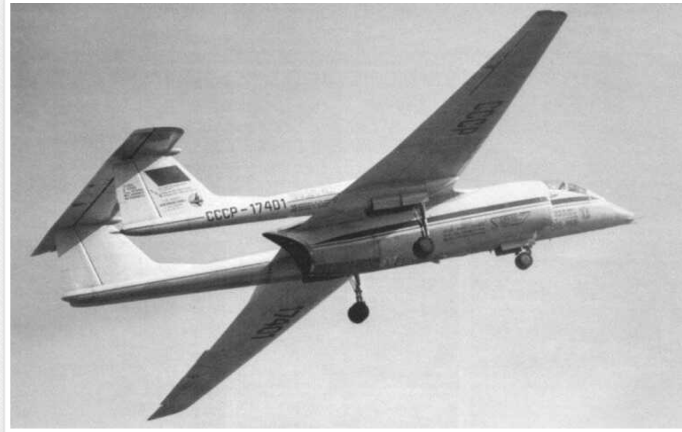
Окупанти після збиття А-50 знову підняли в небо раритетний М-55 "Геофізика": унікальна ціль для ЗСУ

Російська окупаційна армія знову підняла у повітря раритетний літак М-55 "Геофізика" зі спеціальною апаратурою для ведення радіоелектронної розвідки. На думку аналітиків, окупанти вирішили повернути до роботи цей літак в якості ролі "літаючої лабораторії".