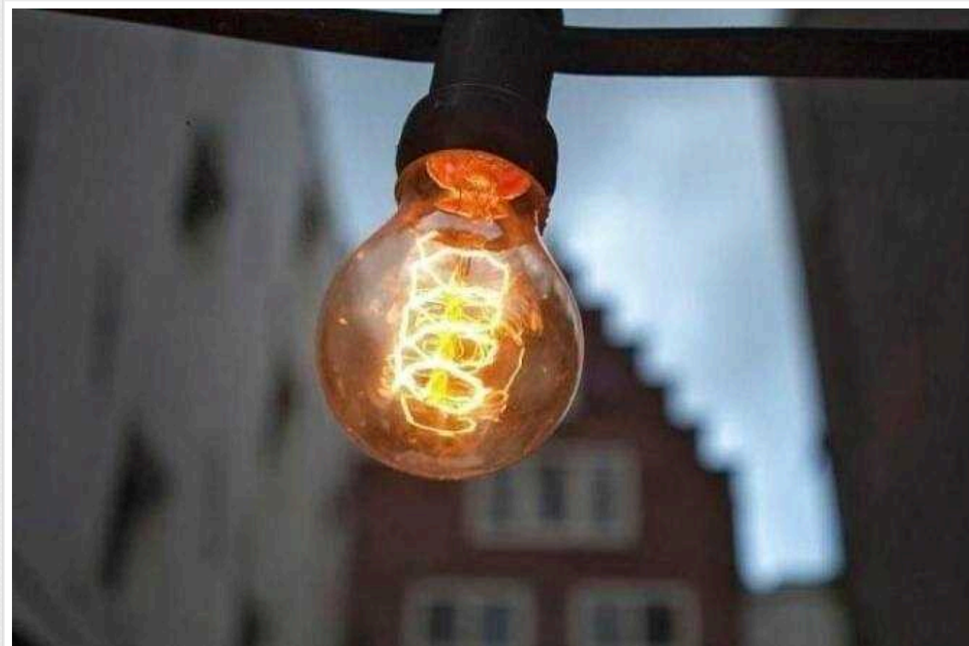
Міненерго закликло українців скоротити споживання електроенергії

В Україні дефіциту електроенергії не фіксується. Внутрішньої генерації достатньо для покриття потреб споживачів. Також планується комерційний імпорту електроенергії. Незважаючи на це, Міністерство енергетики просить скоротити споживання електроенергії.