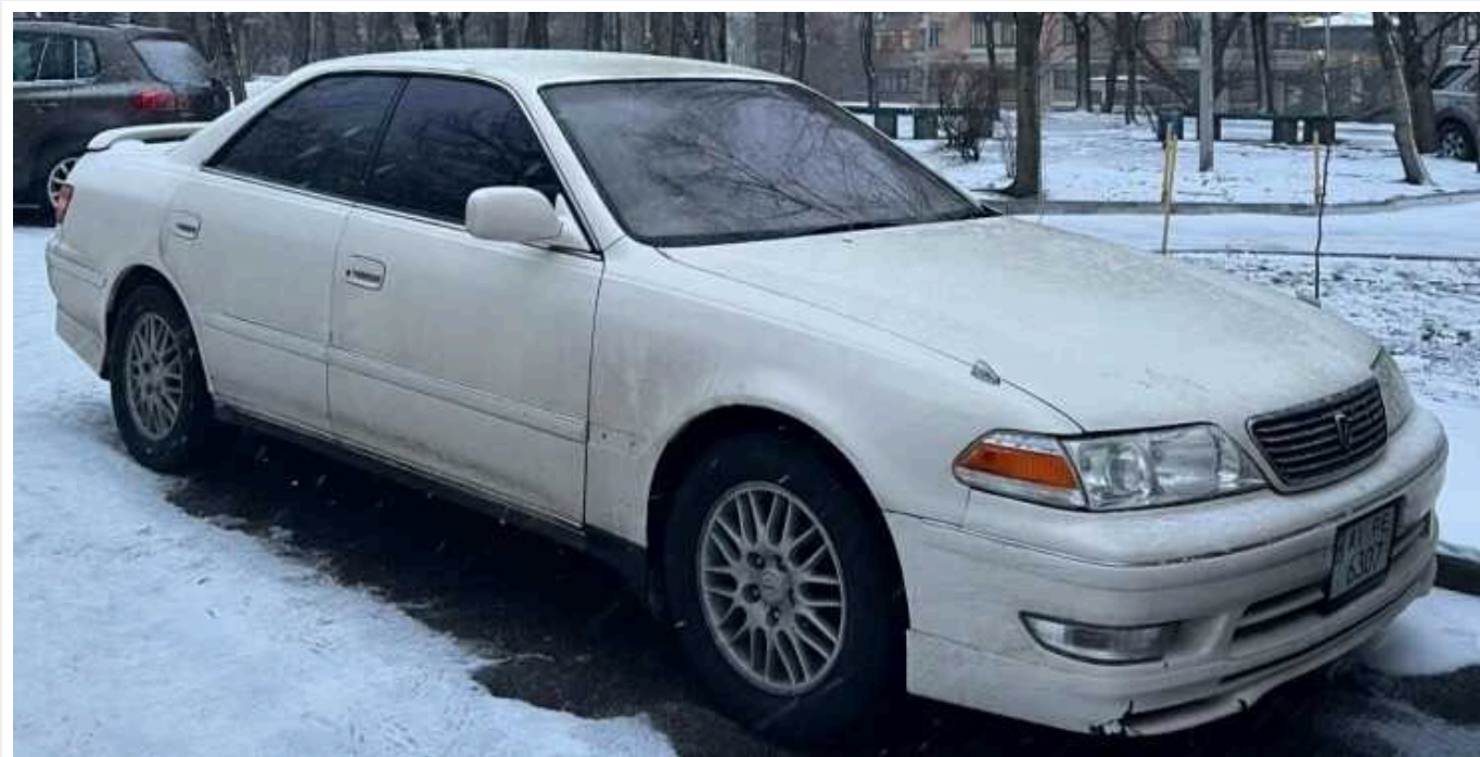
У Києві помітили рідкісну розкішну Toyota з мотором від Supra

Toyota Mark II – преміальний седан E-класу з 3,0-літровою 220-сильною шісткою. Дорога версія Grande оснащена цифровою панеллю приладів, активною підвіскою і клімат-контролем з іонізатором повітря.