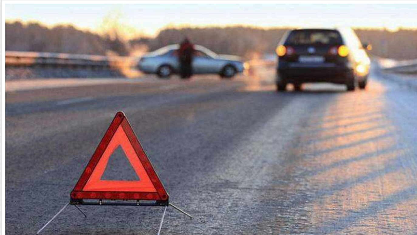
За рік в Україні суттєво збільшило ДТП і зріс рівень смертності

У 2023 році в Україні кількість ДТП зросла на чверть, порівняно з 2022 роком. Смертність внаслідок таких автопригод підвищилася на 9%.