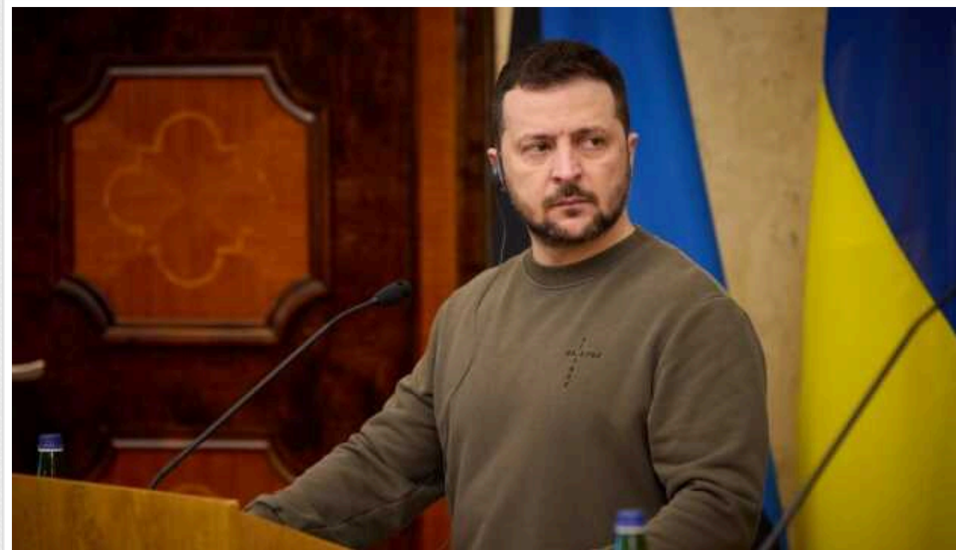
Зеленський: Кожне нове покоління має знати правду про Голокост

Президент Володимир Зеленський у Міжнародний день пам'яті жертв Голокосту наголосив, що кожне нове покоління має знати правду про цю трагедію.