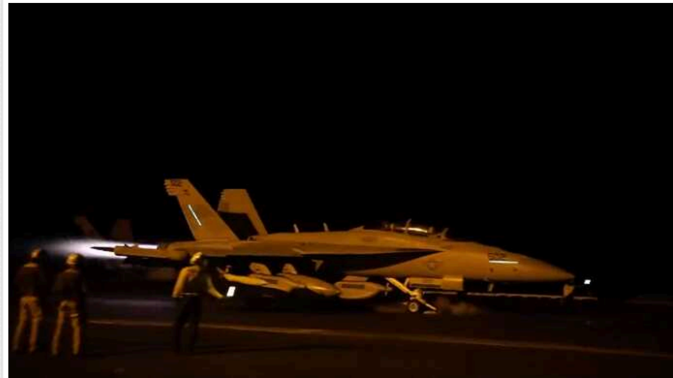
Сполучені Штати уночі завдали удару по військовій інфраструктурі хуситів

Сили Центрального командування Збройних сил США (CENTCOM) повідомили, що в ніч проти 27 січня завдали удару по протикорабельній ракеті хуситів, яка готувалась до запуску в Червоне море.