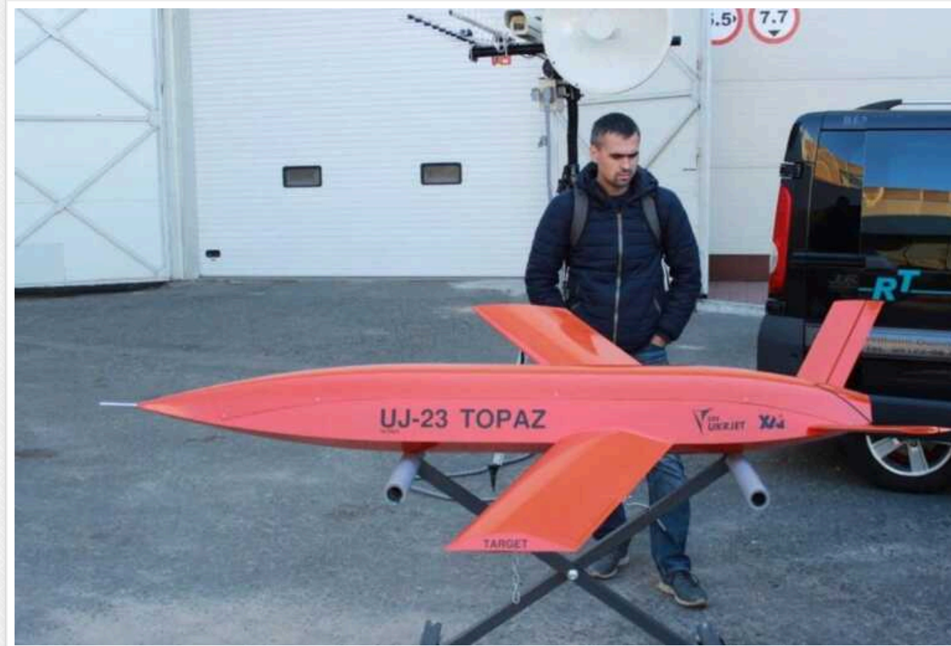
Компанія UKRJET продемонструвала реактивний безпілотник UJ-23 Toraz із дальністю польоту 400 кілометрів

UJ-23 Toraz – це багатопільова безпілотна авіаційна система з реактивним двигуном, яка може використовуватися у будь-який час доби та пори року, у тому числі за несприятливих погодних умов та протидії РЕБ супротивника. UJ-23 може виконувати завдання для розвідувальних та військових операцій.