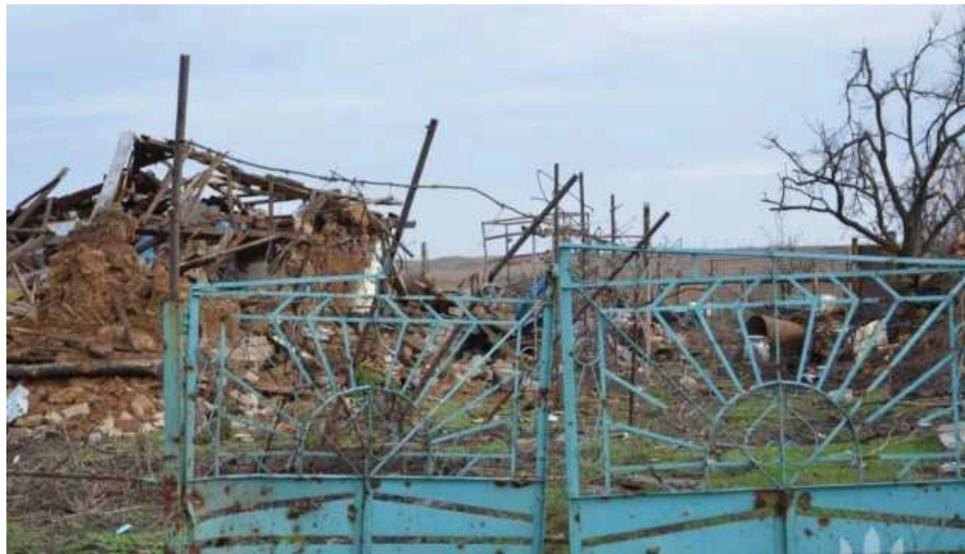
Окупанти за добу завдали 86 ударів по Запорізькій області

Упродовж минулої доби ворог атакував 19 міст та сіл Запорізької області. Окупанти завдали 86 ударів із РСЗВ, артилерії та безпілотників.