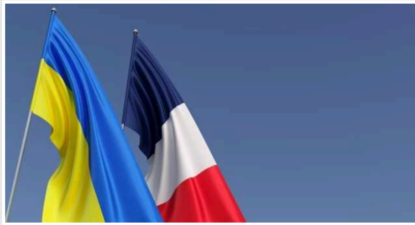
Франція та Україна перейшли до обговорення проєкту угоди про "гарантії безпеки"

Українська переговорна група 26 січня провела черговий раунд переговорів із Францією про безпекові зобов'язання в межах декларації "Групи семи", перейшовши до опрацювання проєкту двосторонньої угоди.