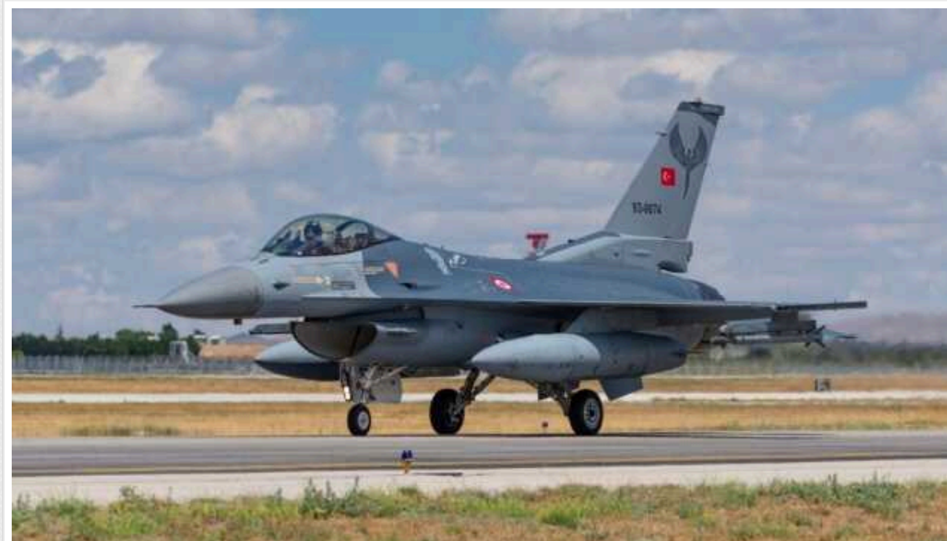
США, після схвалення вступу Швеції до НАТО, розблокували продаж Туреччині F-16

Державний департамент США схвалив продаж Туреччині винищувачів F-16 і засобів для їхньої модернізації, що сталося після ратифікації нею протоколу про вступ Швеції до Північноатлантичного альянсу.