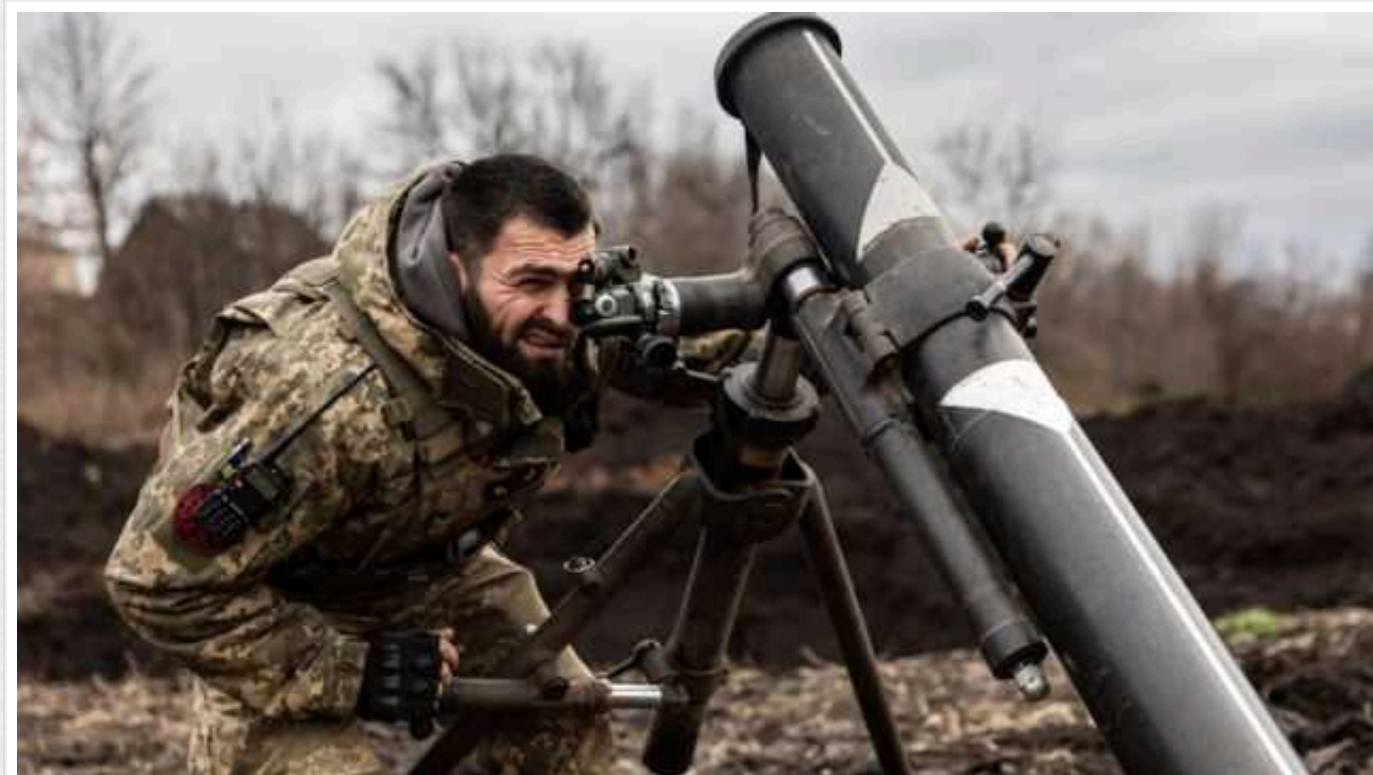
Ситуація на фронті: за добу відбулося майже 100 бойових зіткнень, найбільше – на Авдіївському напрямку

За минулу добу на фронті відбулося 98 бойових зіткнень, найбільше – 29 – на Авдіївському напрямку.