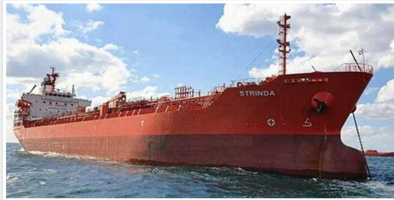
У Червоному морі британський нафтовий танкер Marlin Luanda був уражений ракетою хуситів: виникла пожежа

Про це компанія Traqfigura повідомила The Independent.