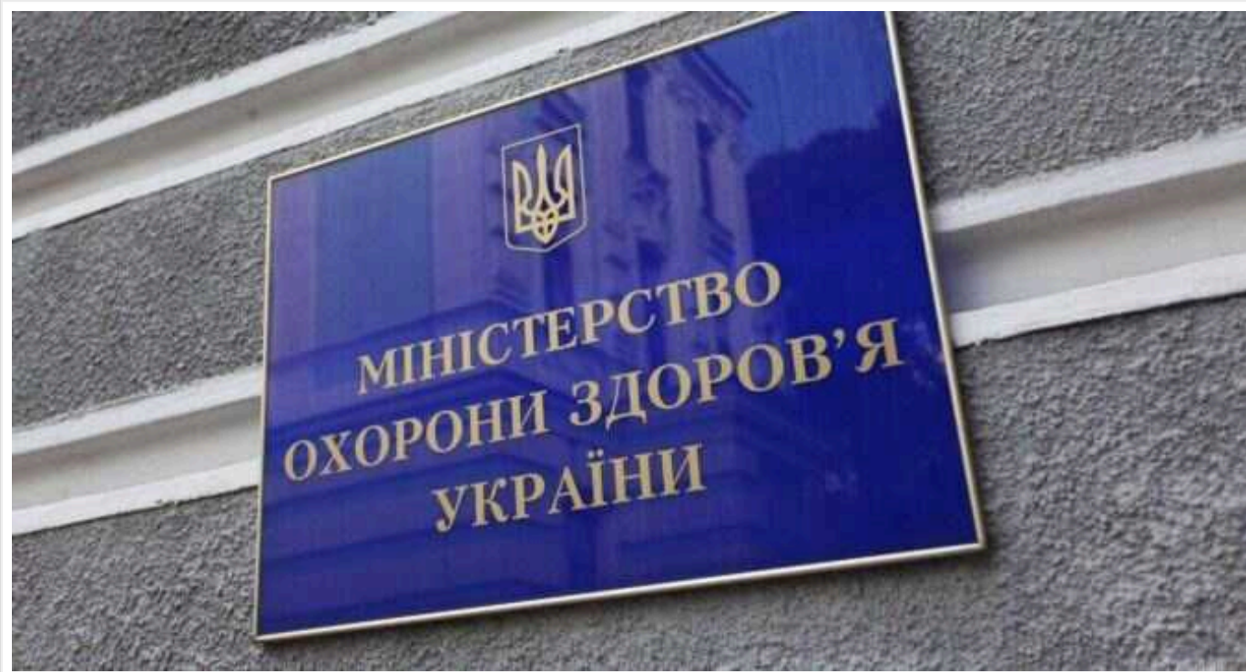
Використання репродуктивних клітин загиблих військових: МОЗ України підтвердив наявність «законодавчої колізії»

МОЗ України підтвердило, що існує «законодавча колізія», через яку репродуктивні клітини загиблих військових неможливо використовувати для продовження роду.