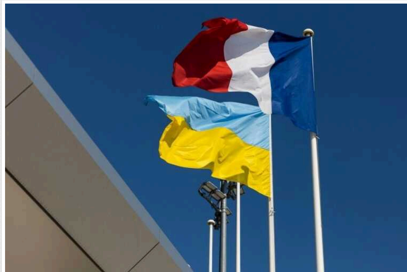
Гарантії безпеки: Україна та Франція обговорили ключові елементи документа

Україна та Франція на чергових переговорах щодо двосторонньої угоди безпеки перейшли до прямого опрацювання проєкту і обмінялися позиціями щодо ключових елементів документа.