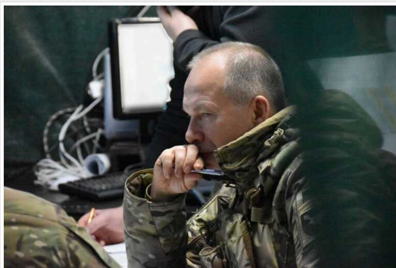
Сирський: Окупанти намагаються розвинути наступ на Часів Яр і в напрямку Сіверська

На фронті на сході України оперативна обстановка залишається складною. Російські окупанти нарощують інтенсивність наступальних дій на Сіверському та Бахмутському напрямках.