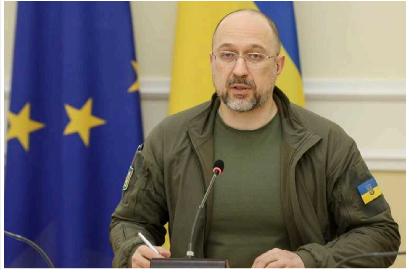
Шмигаль: ВПО отримуватимуть виплати до березня, потім - нові розрахунки виплат

Читати на русском Додати як бажане джерело в Google