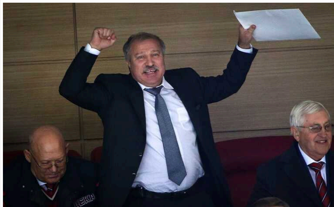
ВАКС конфіскував частину активів довіреної особи Путіна

Йдеться про такого собі Едуарда Худайнатова, на якого зареєстрована яхта Путіна під назвою «Шахерезада», а також яхта олігарха Керімова.