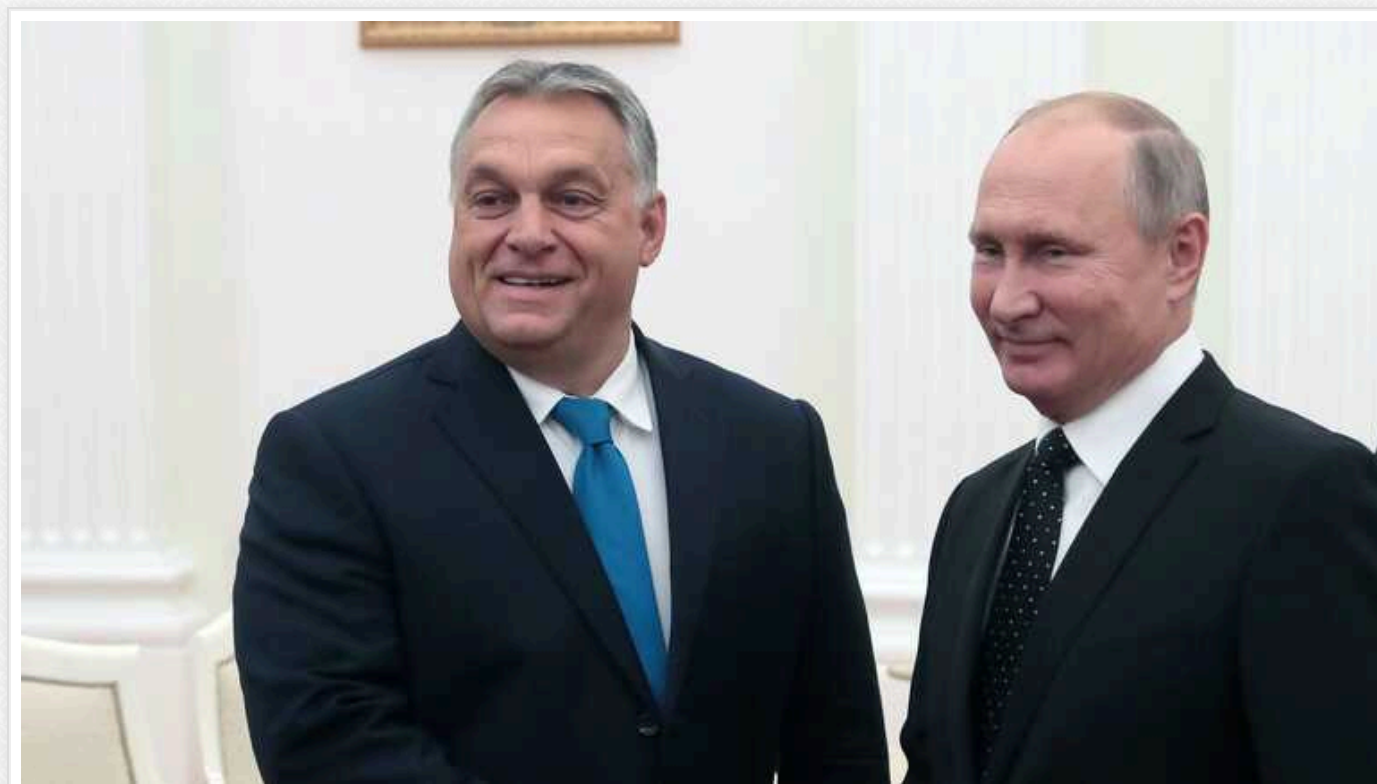
Reuters: Переговори в ЄС про виділення 50 мільярдів євро Україні ускладнилися через позицію Угорщини

Про це повідомляє агентство Reuters із посиланням на неназваного високопосадовця Євросоюзу.