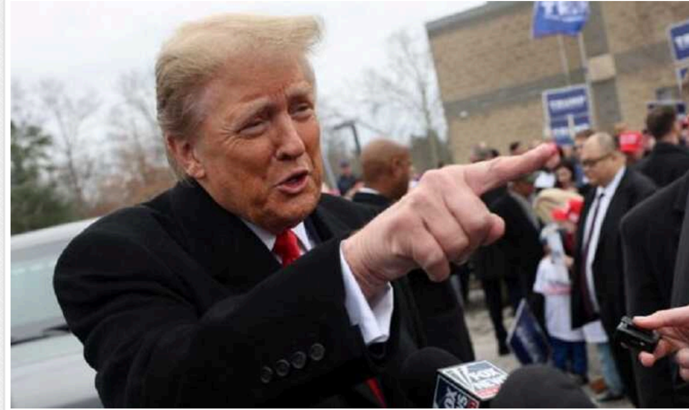
Допомога Україні від США на волосині: Трамп намагається зірвати угоду в Конгресі

Допомога Україні від США на волосині, оскільки Трамп намагається зірвати угоду в Конгресі, що пов'язує збільшення фінансування Києва з посиленням контролю над імміграцією.