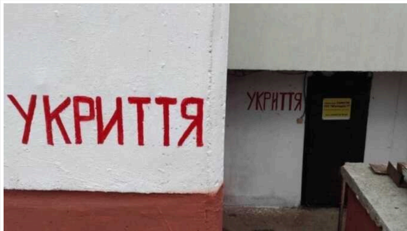
У столиці наркомани окупували нове бомбосховище

Лише в одному районі столиці бомжі та наркозалежні захопили 19 укриттів.