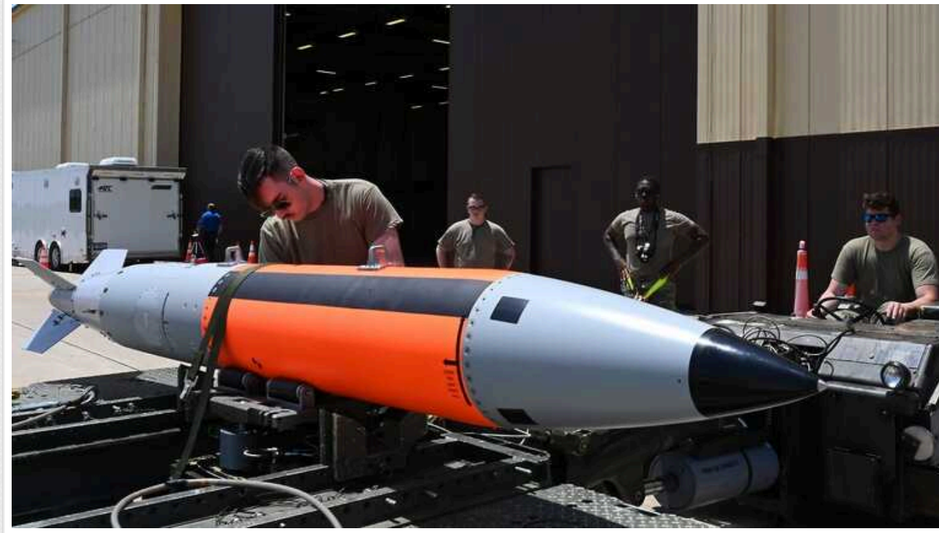
The Daily Telegraph: США мають намір уперше за 15 років розмістити свою ядерну зброю на території Великобританії

Видання виявило в документах Пентагону кілька згадок про план, який може передбачати розміщення ядерних боєприпасів на військовій базі Лейкенхіт в англійському графстві Саффолк.