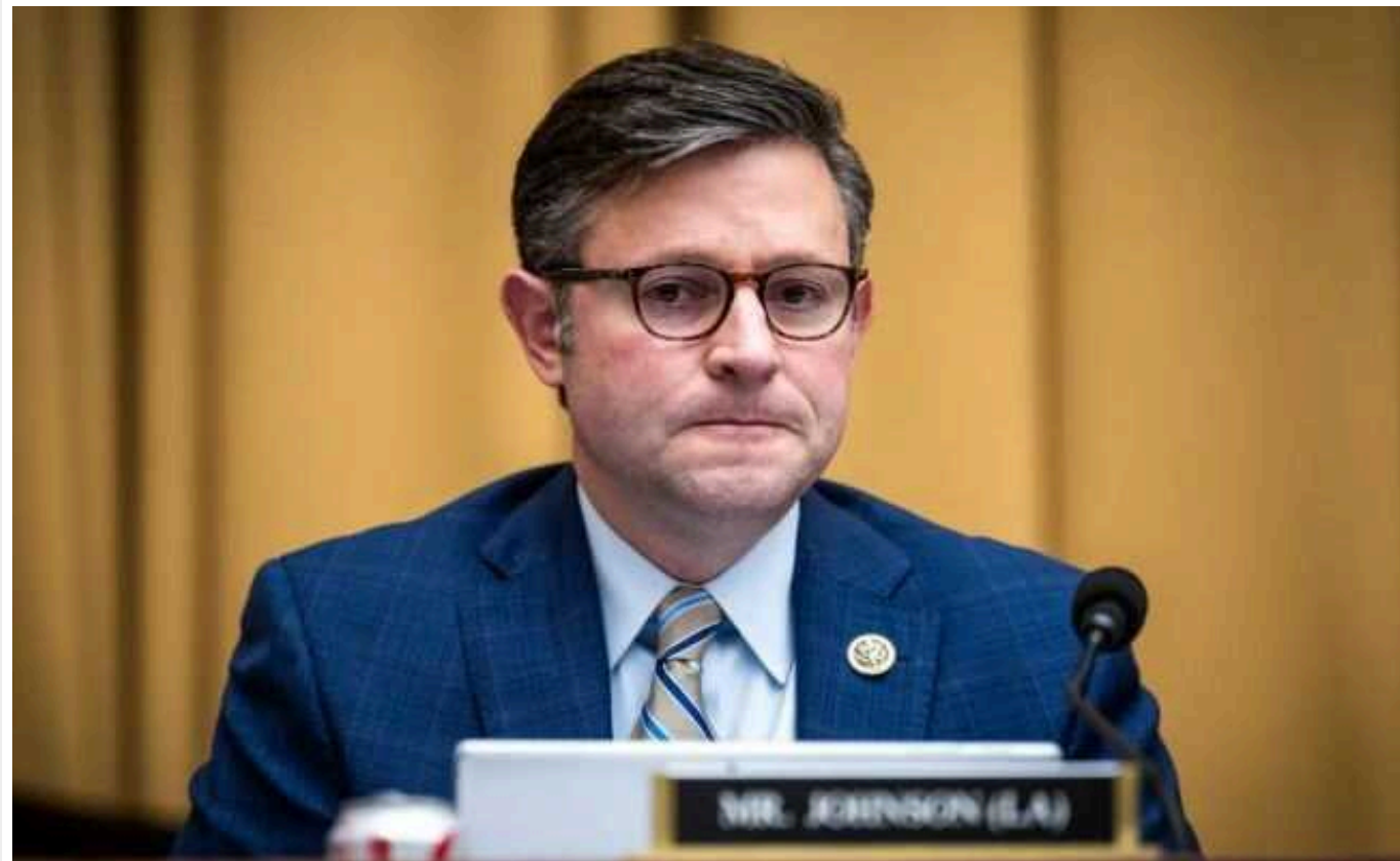
Спікер Конгресу Джонсон: законопроект про фінансування допомоги Україні та безпеку кордону - "нежиттєздатний"

Спікер Палати представників американського Конгресу Майк Джонсон заявив, що угода про фінансування постачання зброї Україні та Ізраїлю "вже померла" та приречена на провал, навіть якщо пройде голосування у Сенаті.