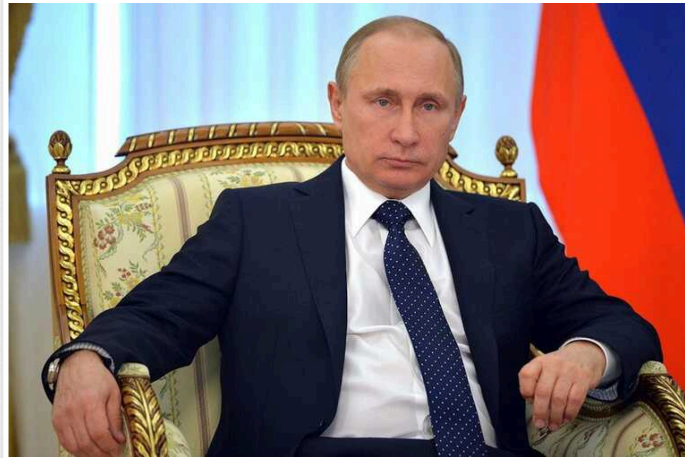
Путін пояснив, чому почав вторгнення в Україну: "Росія оголосила нетитульною нацією"

Російський президент заявив, що після 2014 року Україна нібито почала винищувати на Донбасі людей та сама розпочала війну. На його думку, повномасштабне вторгнення РФ в Україну є лише способом закінчити це.