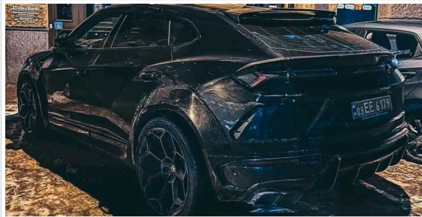
В Україні з'явився потужний кросовер Lamborghini з яскравим тюнінгом

Тюнінг Lamborghini Urus від Novitec Group включає обвіс, спойлери і 23-дюймові диски. Потужність двигуна V8 можуть збільшити до 782 сил.