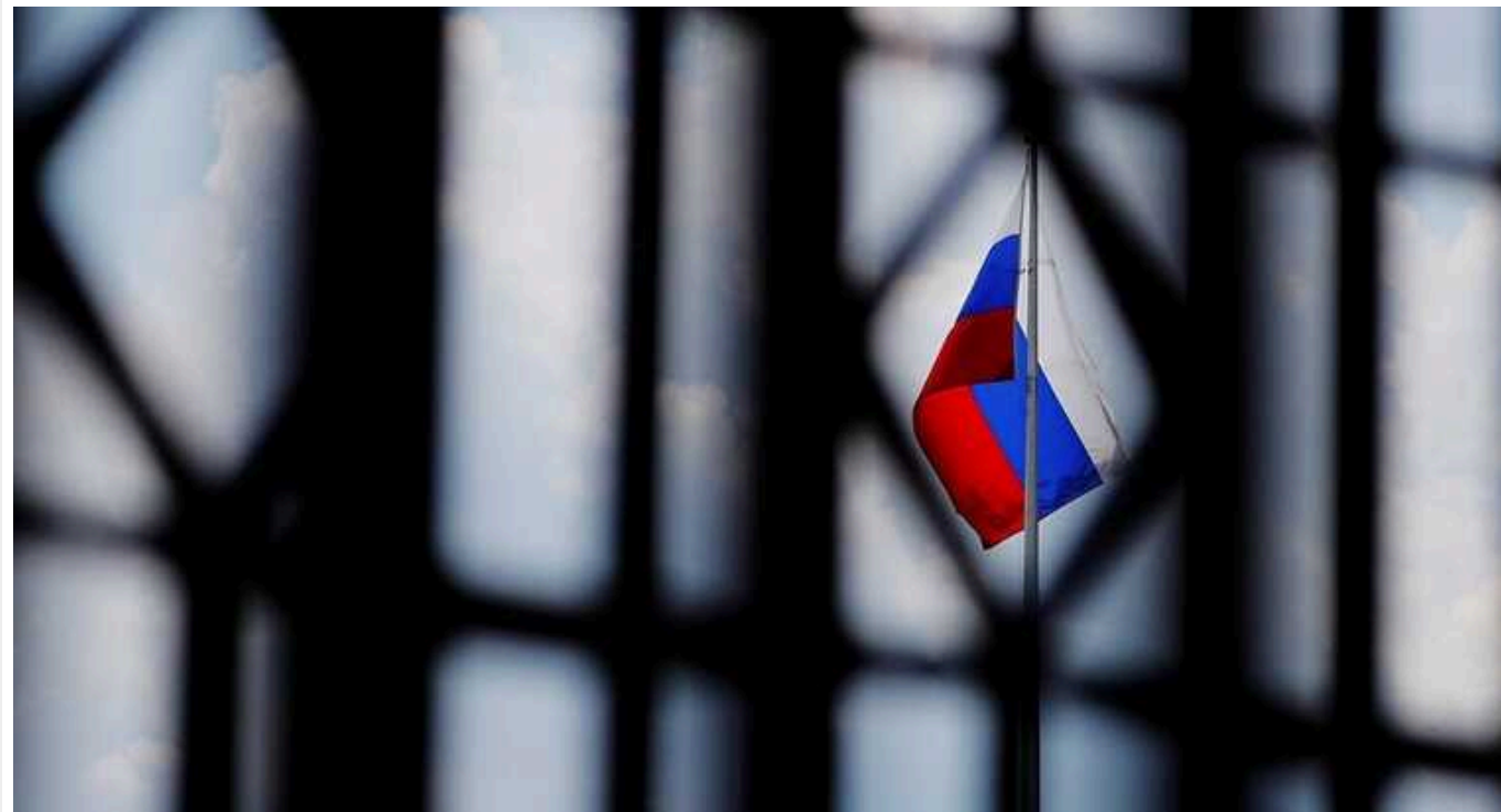
Латвія відкрила понад 250 кримінальних справ через порушення санкцій проти РФ

З моменту введення санкцій проти Росії та Білорусі правоохоронні органи Латвії розпочали понад 250 кримінальних процесів за фактом їхнього порушення.