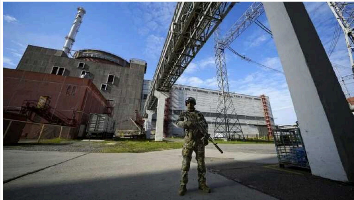
"Енергоатом" попередив про нову загрозу радіаційній безпеці на ЗАЕС

На підконтрольній російським окупантам Запорізькій атомній електростанції (ЗАЕС) найближчим часом спливає дозволений виробником 6-річний термін перебування ядерного палива в усіх шести реакторах.