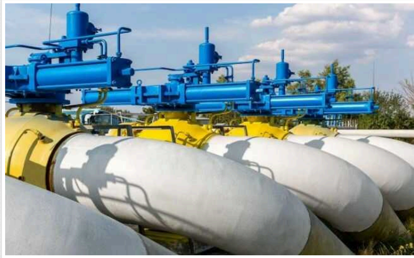
Євросоюз готується до припинення транзиту російського газу через Україну, - Bloomberg

Європейський союз не розраховує на продовження угоди щодо транзиту газу з РФ через Україну після завершення договору наприкінці поточного року. Брюссель аналізує потенційні сценарії з альтернативним постачанням "блакитного палива" до Європи.