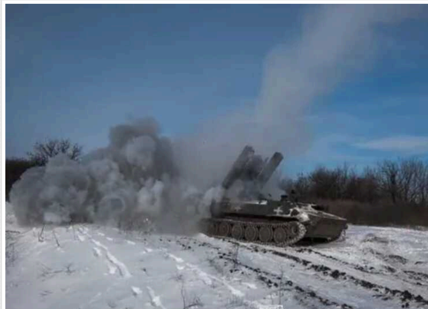
DeepState: ЗСУ просунулися західніше Вербового, східніше Тернів тривають бої

Українські захисники просунулися західніше Вербового на Запоріжжі. Східніше Тернів на Донеччині тривають бойові дії, тож лінія зіткнення уточнюється.