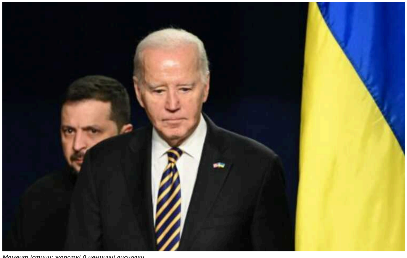
Момент істини: жорсткі й неминучі висновки

Коли Кремль розпочає повномасштабну війну проти України, він зробив це у переконанні, що Заходу бракує стратегічної мети, стійкості та моральних якостей, щоб дозволити Україні успішно її завершити.