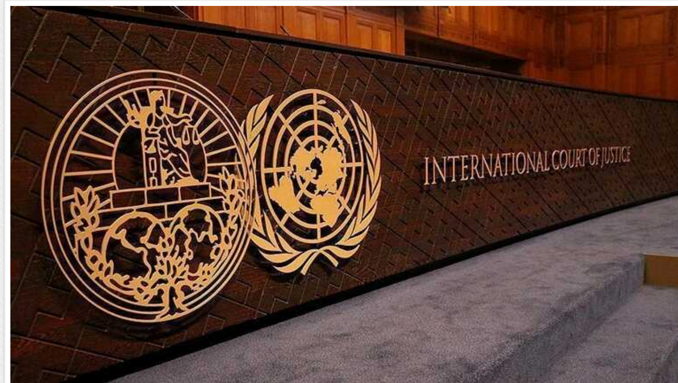
У Міжнародному суді ООН закликали Ізраїль припинити геноцид палестинців у секторі Гази