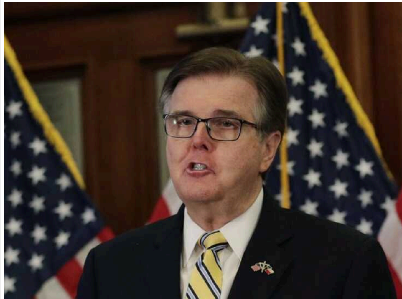
У США набирає обертів конфлікт Вашингтона з Техасом

Віцепублічний штату Ден Патрік закликає адміністрацію Білого дому не розпочинати конфронтацію з техаськими силовиками.