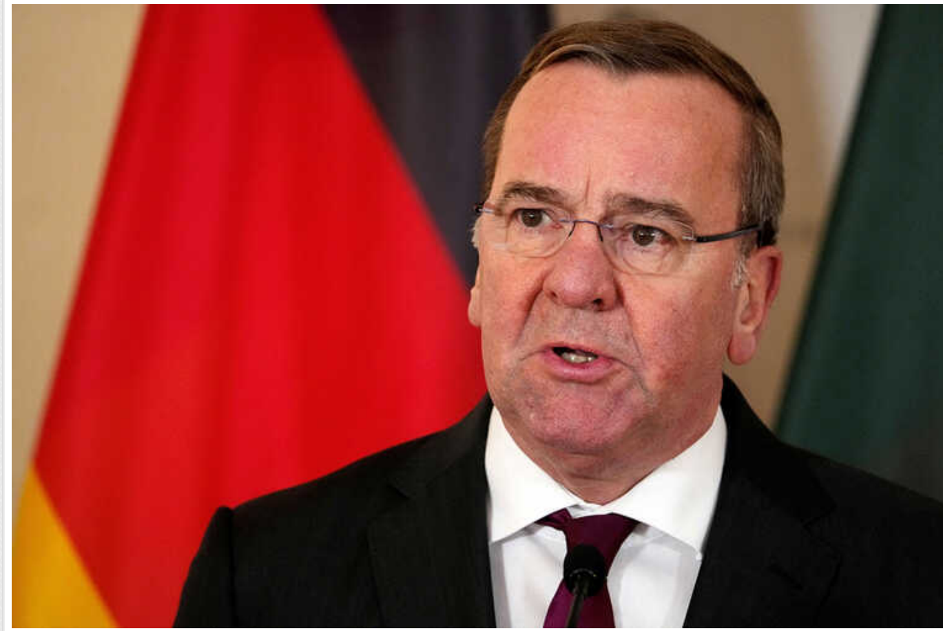
У Міноборони Німеччини роз'яснили ідею приймати на службу до армії людей без німецького громадянства

Судячи з його слів, українські біженці до неї вступити не зможуть.