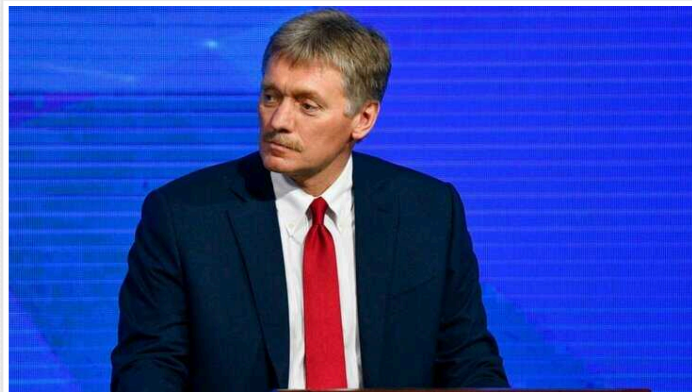
У Кремлі спростовують інформацію Bloomberg, що РФ готова погодитись на вступ України до НАТО

"Ні, це неправильне повідомлення, воно абсолютно не відповідає дійсності", - заявив речник президента РФ Дмитро Песков, відповідаючи на відповідне питання.