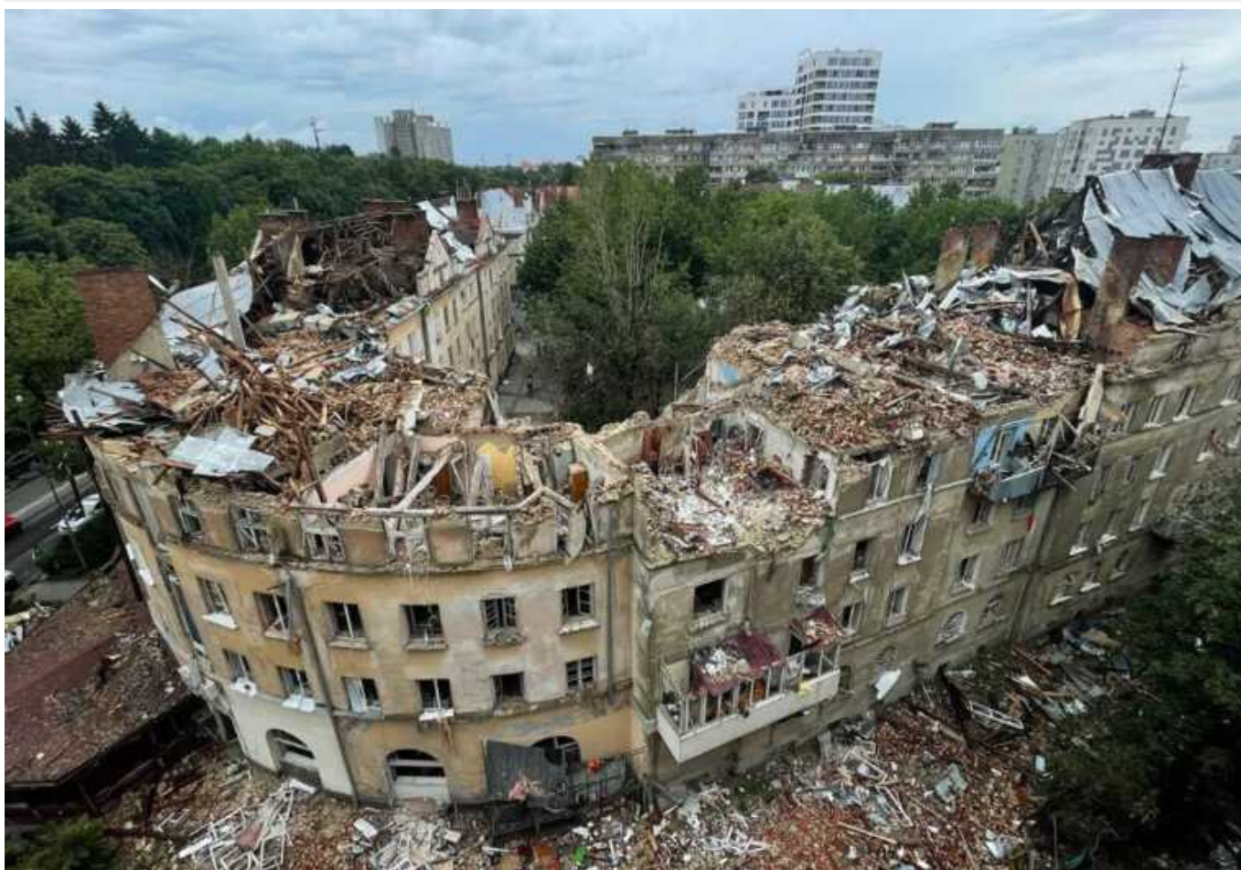
У Львові майже відновили будинки, які знищила російська ракета

У Львові за пів року відремонтували фасад і дах багатопверхівок на вулиці Стрийській, які знищила під час масованої атаки країна-агресор Росія. Окупанти 6 липня поцілили по житловій забудові міста "Калібрами", вбили сім і поранили десятки людей.