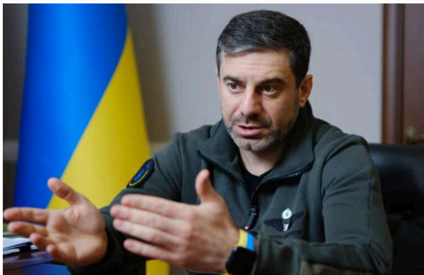
Омбудсмен звернув увагу на брехню РФ щодо падіння літака Іл-76: "Деяких полонених з російського списку вже обміняли"

Російські пропагандисти допустились промаху та самі себе викрили у брехні. В оприлюдненому ними списку українських військовополонених, які нібито перебували на борту збитого літака Іл-76, є імена українських бійців, яких уже обміняли раніше.